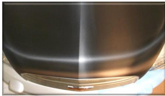
Figura 2. Film dañado vs. film no dañado post-instalación