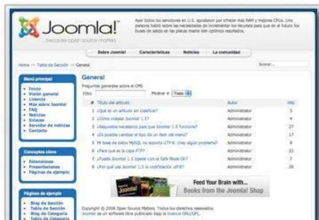
Tabla (lista de artículos que pueden ordenarse pulsando en el título de la columna)

Blog (selección de artículos que muestran un texto introductorio a una o varias columnas)