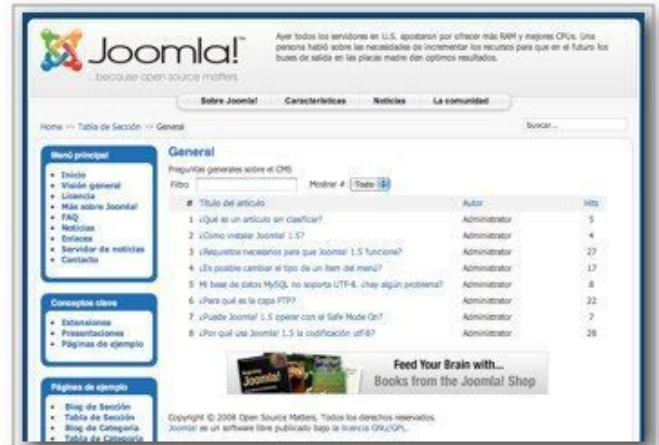
Tabla (lista de artículos que pueden ordenarse pulsando en el título de la columna)

Blog (selección de artículos que muestran un texto introductorio a una o varias columnas)