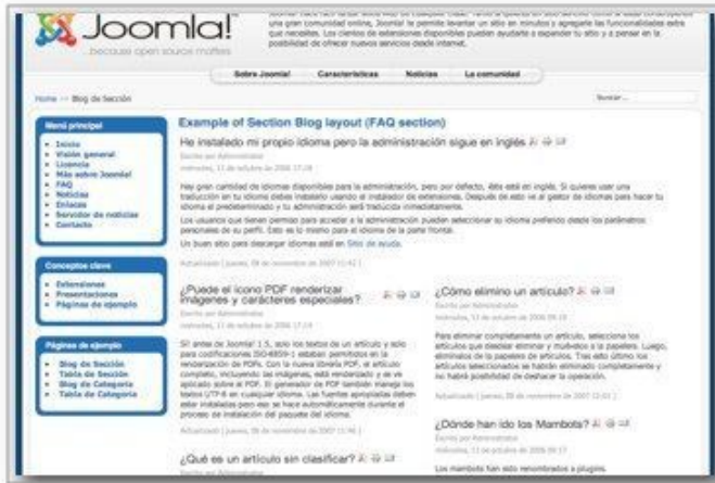
Blog (selección de artículos que muestran un texto introductorio a una o varias columnas)