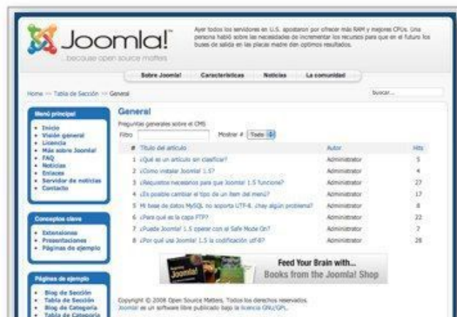
Tabla (lista de artículos que pueden ordenarse pulsando en el título de la columna)

Blog (selección de artículos que muestran un texto introductorio a una o varias columnas)